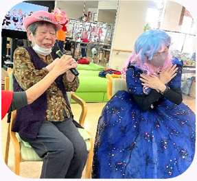
♪青い目をしたお人形は〜♪