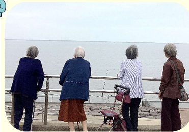
秋の日に干潟ドライブ