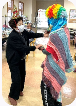
華やかなステップ

サンテでは、毎月末にその月の誕生者の方をお祝いする「誕生会」を催しています。ご利用者様も職員も一緒に歌ったり踊ったりと、毎回盛り上がっています(感染対策を行っています)。